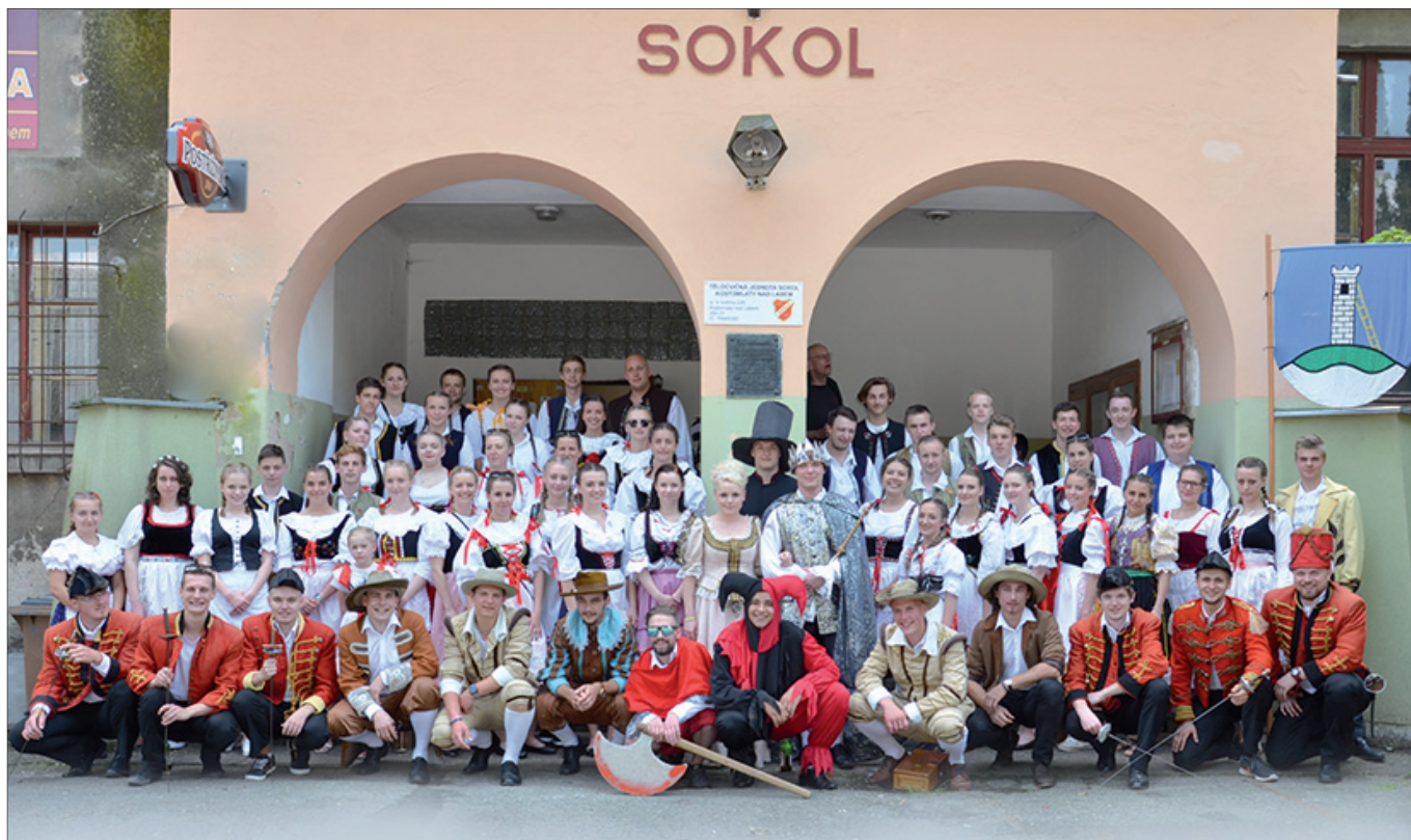
Staročeské Máje Kostomlaty n.Labem 2018