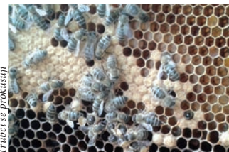
Trubci se probírají