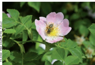
Včela na šípkové trtici

raci včel schopnou přežít zimu, dochází k rojení v nejlepší části roku, v květnu, kdy je pastvy dostatek. U včelstva převládne rozmnožovací pud, vše ostatní je utlumené. I za silné snůšky ustává ruch na česně, dělnice se nestarají o matku, pouze ji donutí zaklásť vystavené materi misky-základy matečnicků. Matka je málo živená, zeštlhlá a je schopná letu. S rojem vylétají trubci a dělnice různého stáří s plnými mednými volátky. Letí do nejistoty a tyto zásoby jim tak vydrží na první dny